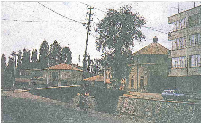
Aksaray'da Melendiz çayı kenarında evler

Şehrin iktisadî ve ticarî faaliyetinde bilhassa dokumacılık önemli bir yere sahipti. 1331'de Aksaray'a gelen ünlü seyyah İbn Battûta, koyun yününden imal edilen ve hiçbir yerde benzeri olmayan halıların Şam, Mısır, Irak, Hint, Çin ve diğer Türk illerine kadar gönderildiğini belirtmektedir. Halıcılığa bağlı olan kökboya da bol miktarda üretilmekteydi. XIX. yüzyılda güherçilenin yanında şehrin en önemli ticarî ürününü kökboya teşkil ediyordu. Şehirdeki ticarî ve sınaî hayatın gelişmesinde bilhassa vakıflar büyük rol oynamıştır. Aksaray'da Karamanoğlu İbrâhim Bey'in Konya'daki imaretinin vakfına ait kervansaray, değirmen, hamam ve pek çok dükkânın olması, daha Osmanlı idaresine girmeden önce ticarî ve iktisadî canlılığa sahip olduğunu göstermektedir. XVI. yüzyıl başlarında şehirde bir boyahane, bir bozahane, bir bezirhane ve en az doksan beş dükkân mevcuttu (BA, TD, nr. 387, s. 139). Ayrıca şehirde ve civarında ekonomik faaliyetlerin ağırlığını ziraî mahsuller, meyvecilik ve hayvancılık teşkil etmekteydi.